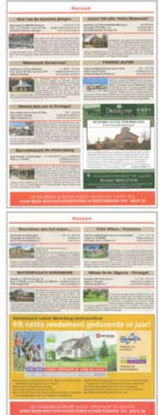
Rubriek 'Huizen' in Elsevier

U vindt de verschijningsdata en advertentietarieven van Elsevier 'Huizen' op de achterzijde.