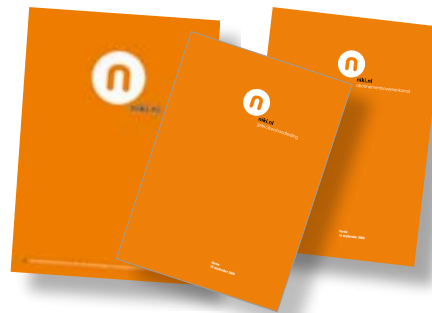
De presentatiemap, gebruikershandleiding en abonnementsovereenkomst

Maar er is nog meer in ontwikkeling: een flexibel inzetbare beurspresentatie voor promotie niki.nl op beurzen, woonmanifestaties etc. (geschikt voor een eigen niki standje of plaatsing in een standje van een abonnee), een niki consumentenflyer, gimmicks, kleding voor een promotieteam, een niki prijsvraag etc. Binnenkort hierover meer.