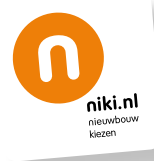
De niki sticker