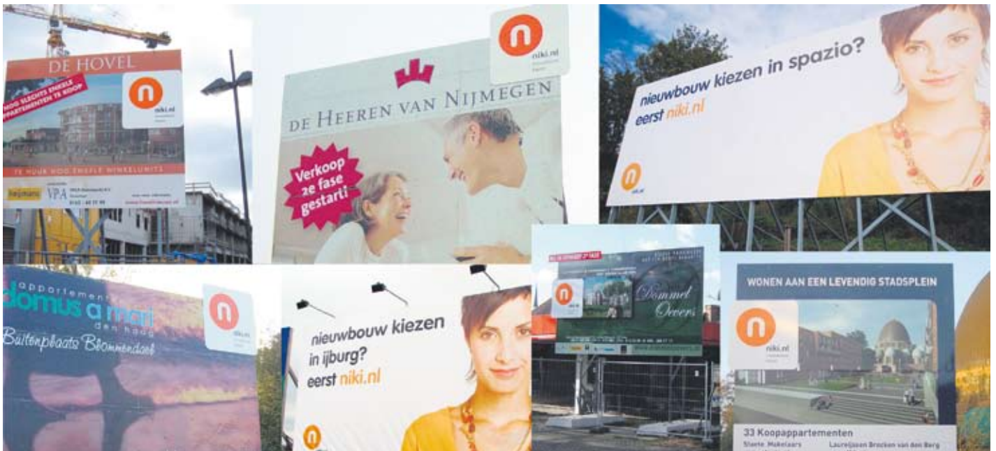
Bouwboarden ter beschikking gesteld voor niki