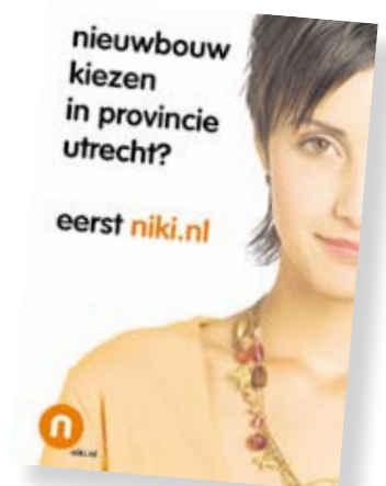
Eén van de advertenties